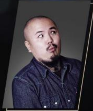
kama KARMA 创始人