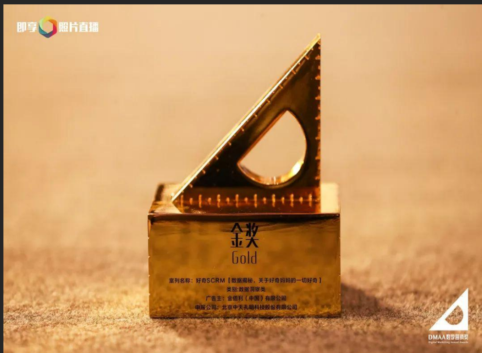
❖ DMAA金奖实物 ❖