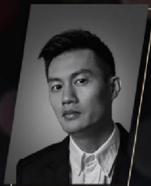
童军 有門neone创意合伙人 创意合伙人